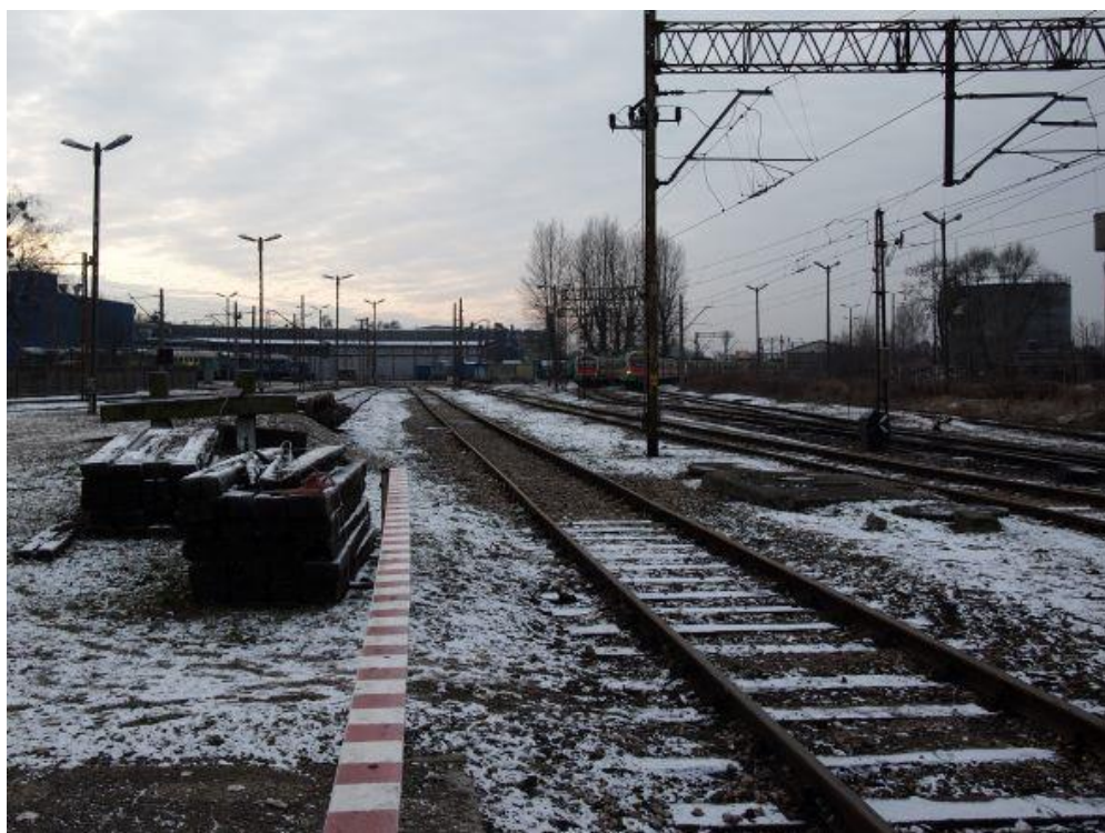
Fot. 7: Miejsce załadunku oznaczone na fotografii literą „c” (po prawej)