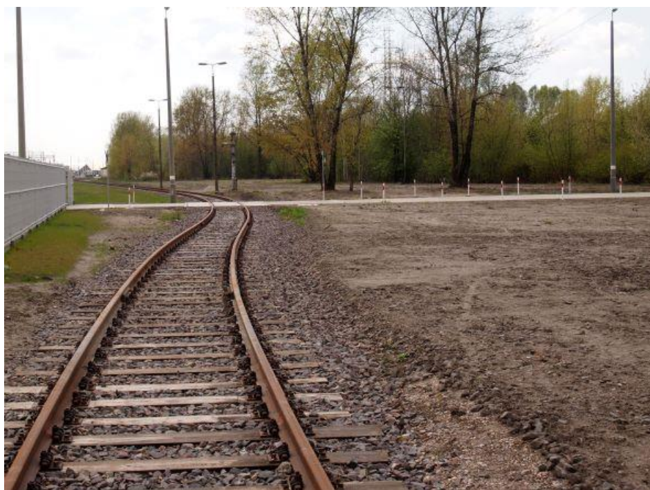
Fot. 95: Tor prowadzący do bramy wjazdowej na skansen Stacji Muzeum, widok w stronę dworca Warszawa Zachodnia