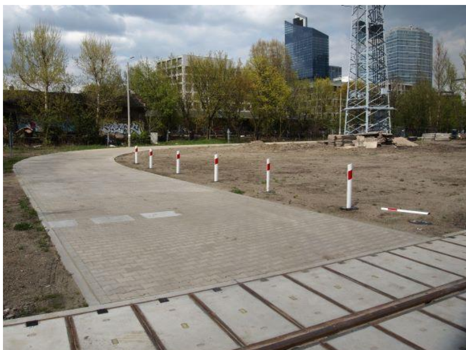
Fot. 71: Droga dojazdowa do nastawni dworca Warszawa Główna