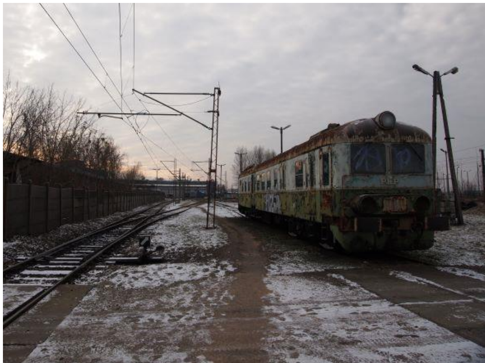
Fot. 4: Miejsce załadunku oznaczone na fotografii literą „a” (po prawej)