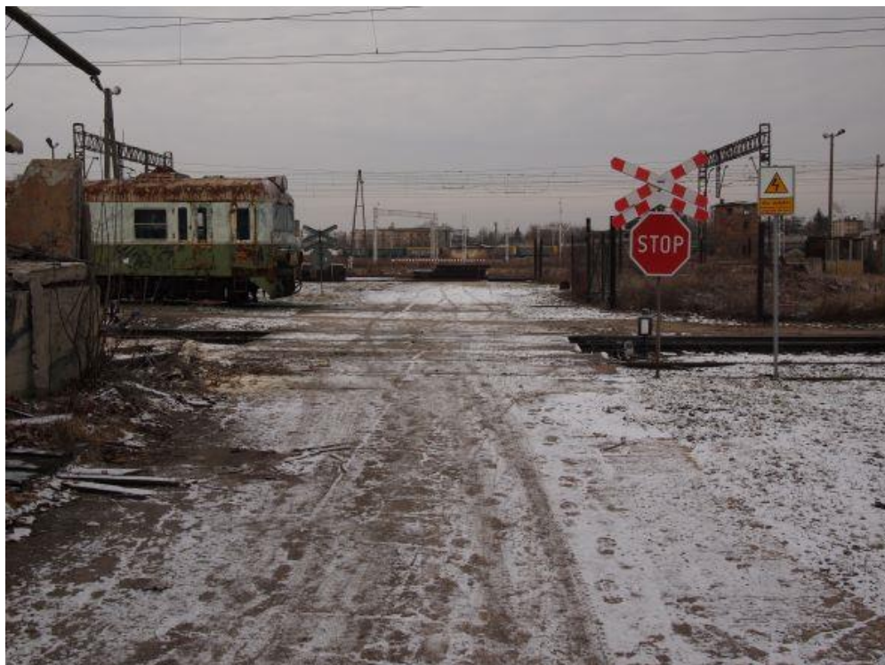
Fot. 3: Wjazd na teren lokomotywni.