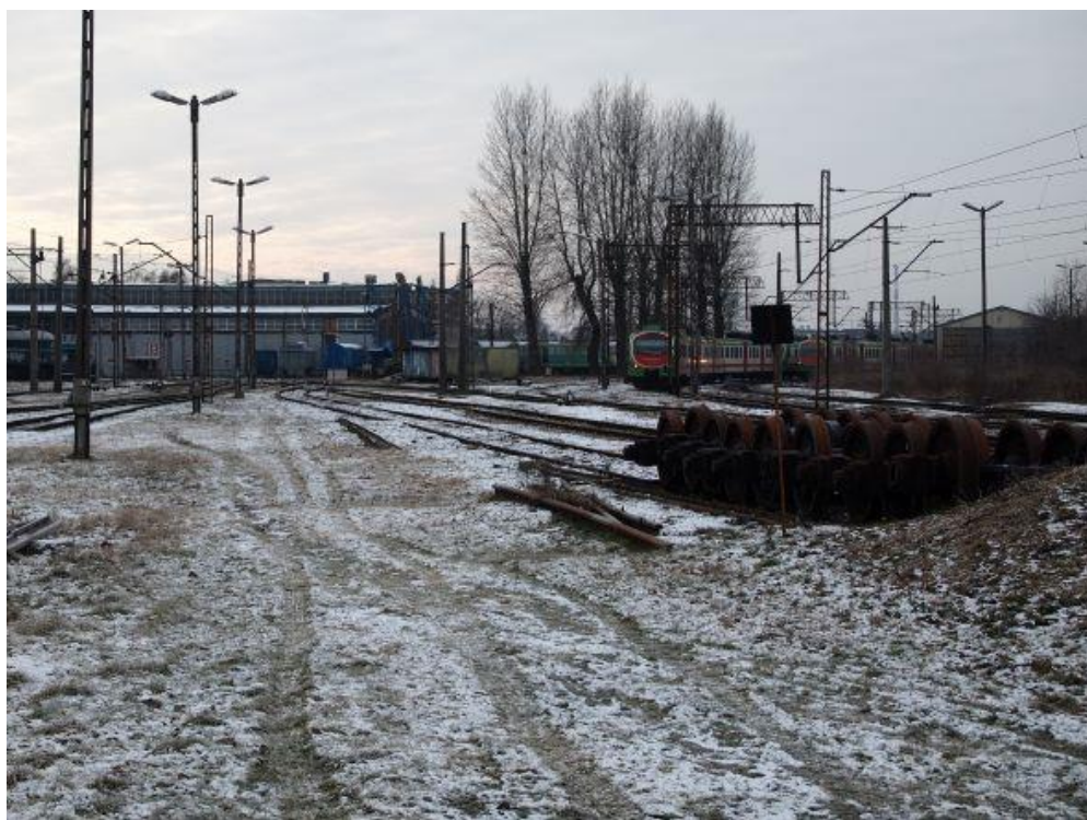
Fot. 5: Miejsce załadunku oznaczone na fotografii literą „b” (po prawej)