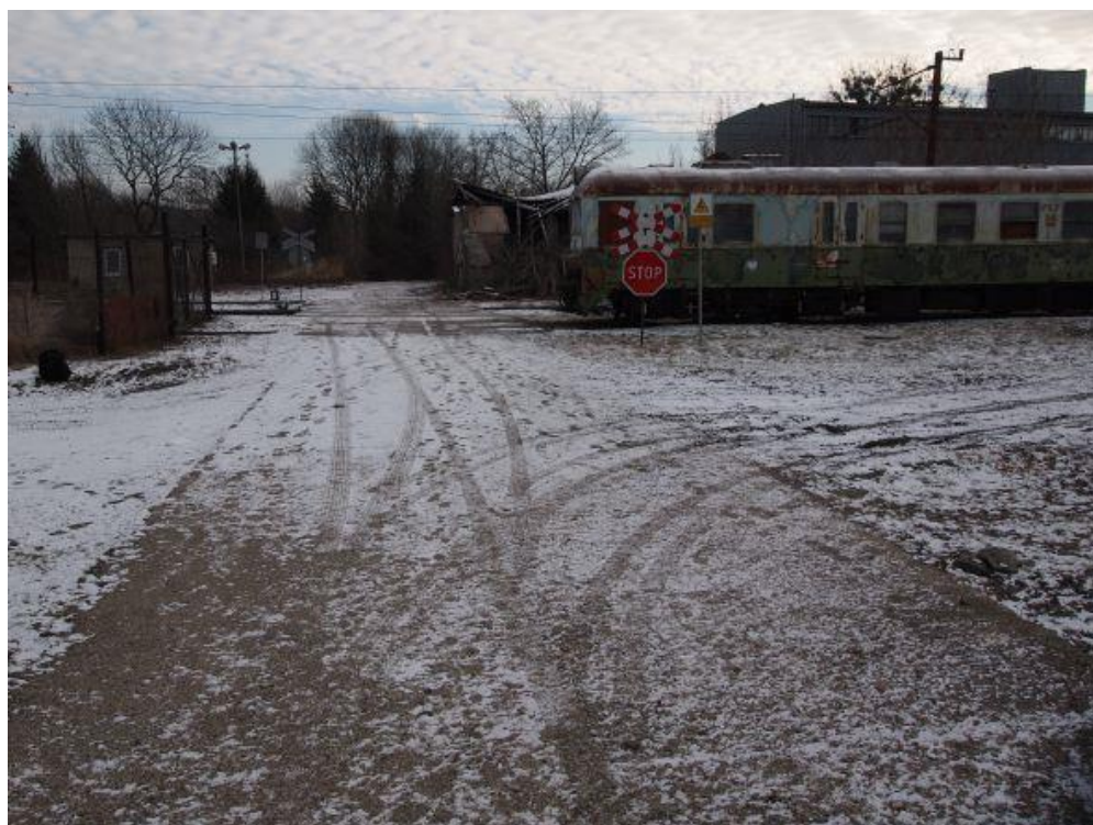
Fot. 4: Wjazd na teren lokomotywni.