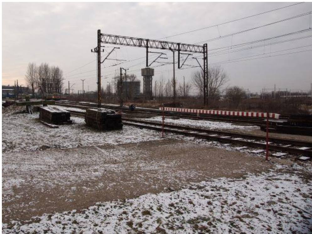
Fot. 6: Miejsce załadunku oznaczone na fotografii literą „c” (po prawej)