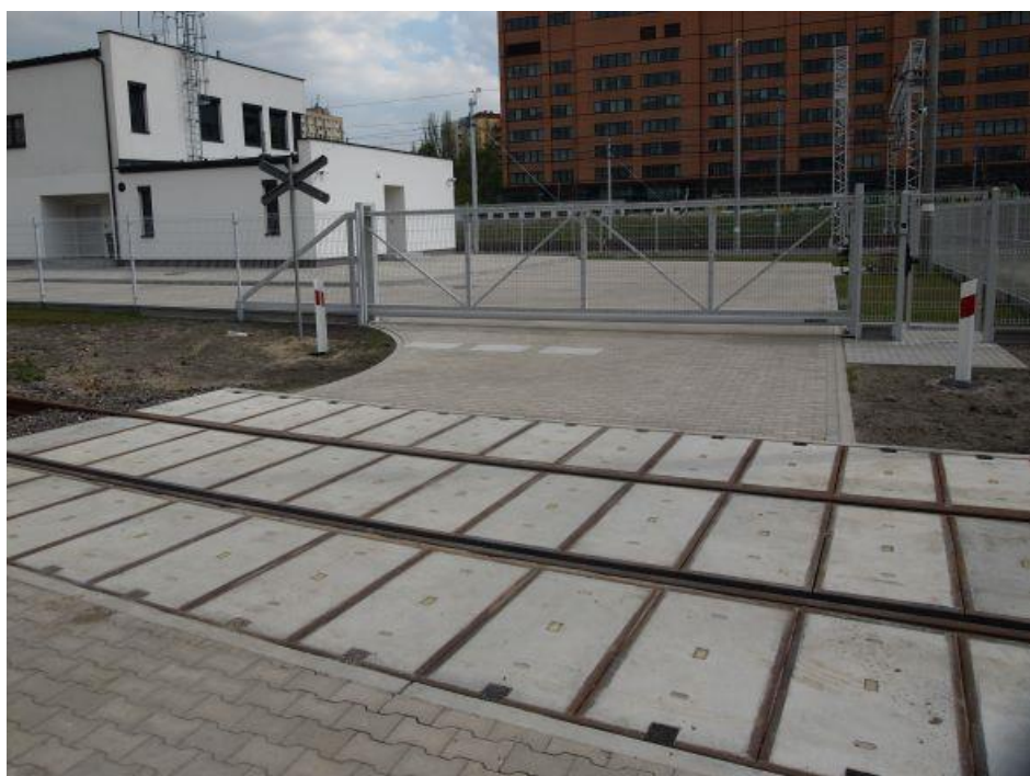
Fot. 13: Brama wjazdowa na teren nastawni dworca Warszawa Główna