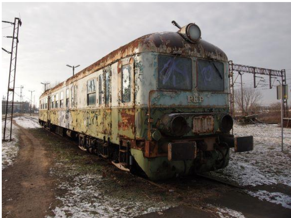
Fot. 1: Wagon spalinowy SN61-133 w obecnej lokalizacji, fot. 2022