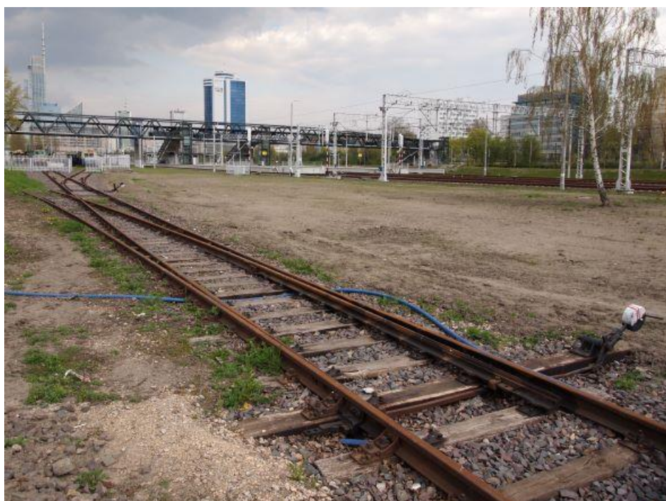
Fot. 17: Tor prowadzący do bramy wjazdowej na skansen Stacji Muzeum, widok od strony dworca Warszawa Zachodnia