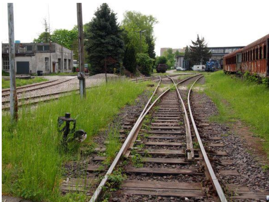
Fot. 5: Tory prowadzące do obrotnicy i hali wachlarzowej