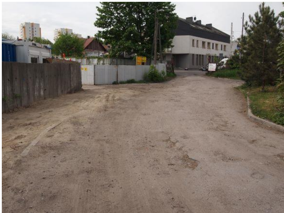
Fot. 12: Droga dojazdowa od strony ul. Kolejowej, widok na bramę wjazdową na teren parowozowni