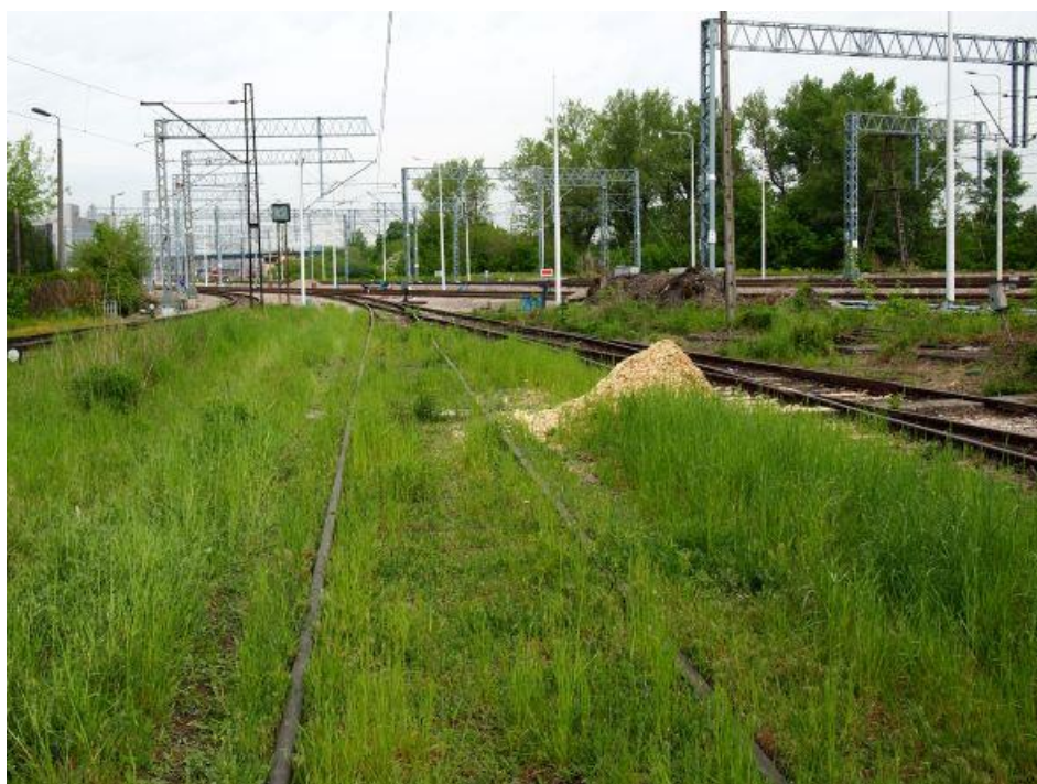
Fot. 3: Wjazd na teren parowozowni Kraków-Płaszów, widok od strony parowozowni