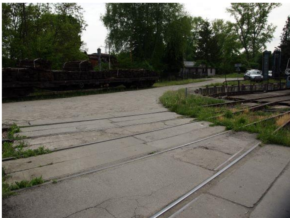
Fot. 6: Tory prowadzące do obrotnicy