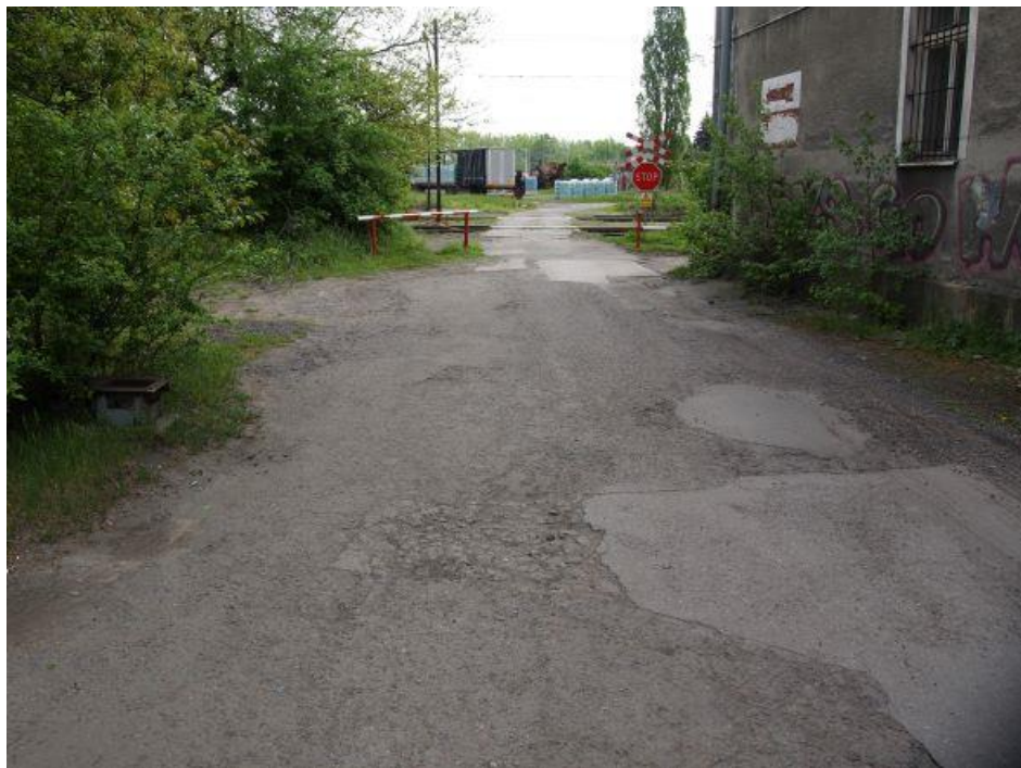
Fot. 14: Brama wjazdowa od strony ul. Prokocimskiej