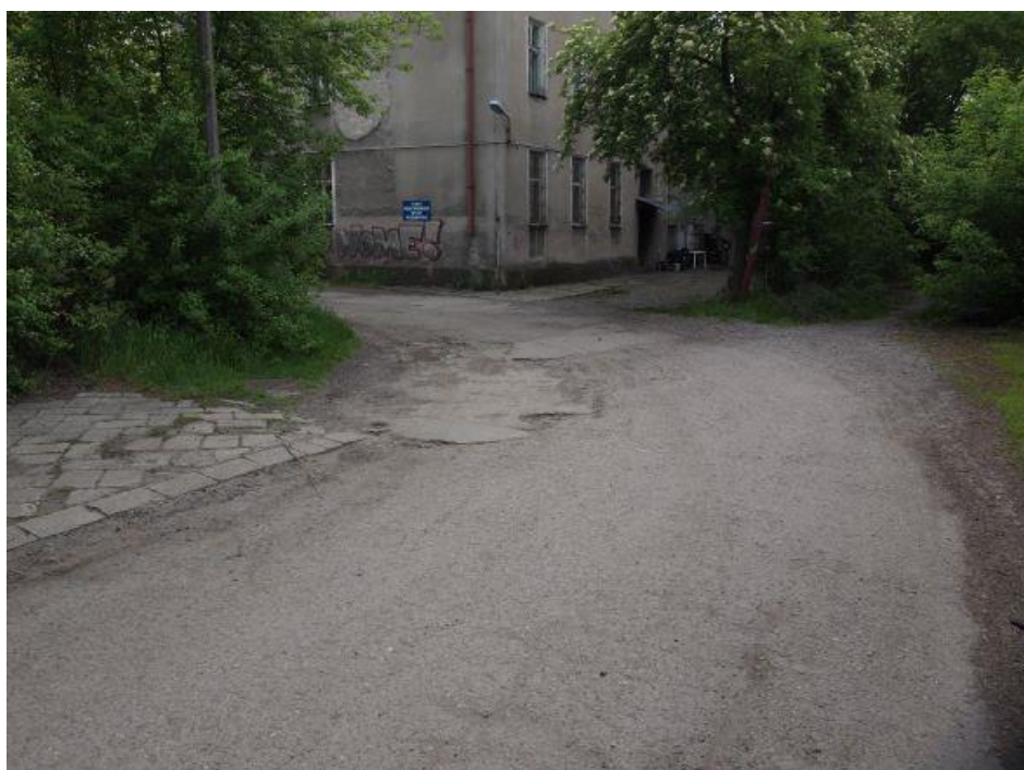
Fot. 13: Droga wjazdowa od strony ul. Prokocimskiej