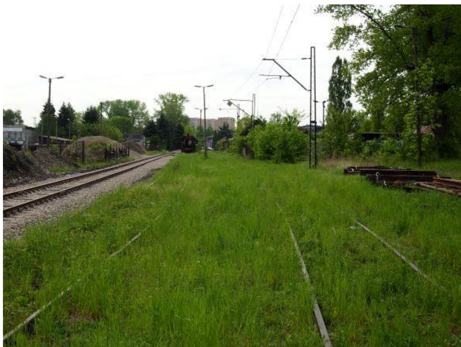
Fot. 4: Wjazd na teren parowozowni Kraków-Płaszów, widok od strony stacji