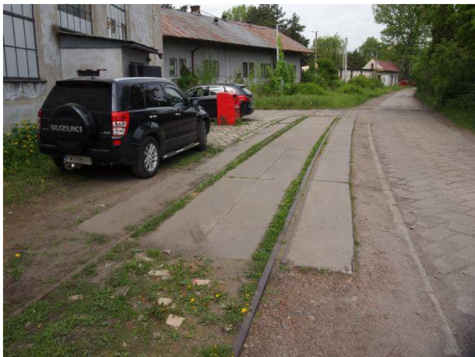
Fot. 8: Proponowany tor załadunku, znajdujący się bezpośrednio przy hali wachlarzowej