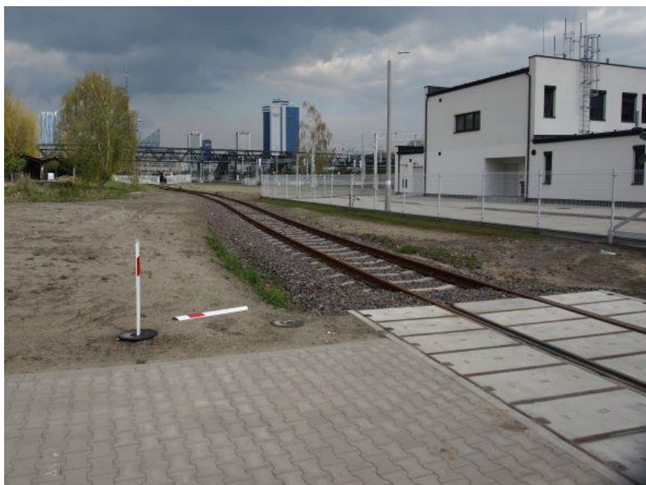
Fot. 19: Tor prowadzący do bramy wjazdowej na skansen Stacji Muzeum, widok od strony dworca Warszawa Zachodnia