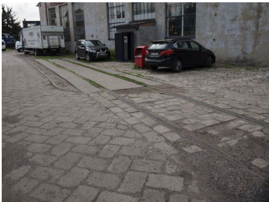
Fot. 7: Proponowany tor załadunku, znajdujący się bezpośrednio przy hali wachlarzowej