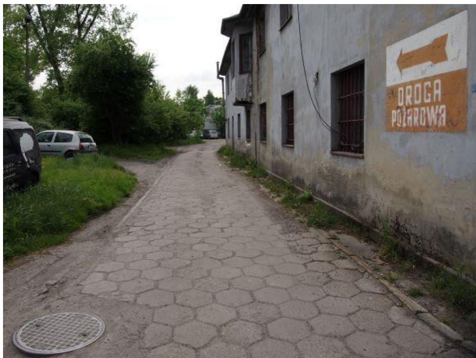
Fot. 10: Droga dojazdowa od strony ul. Kolejowej, widok od strony parowozowni