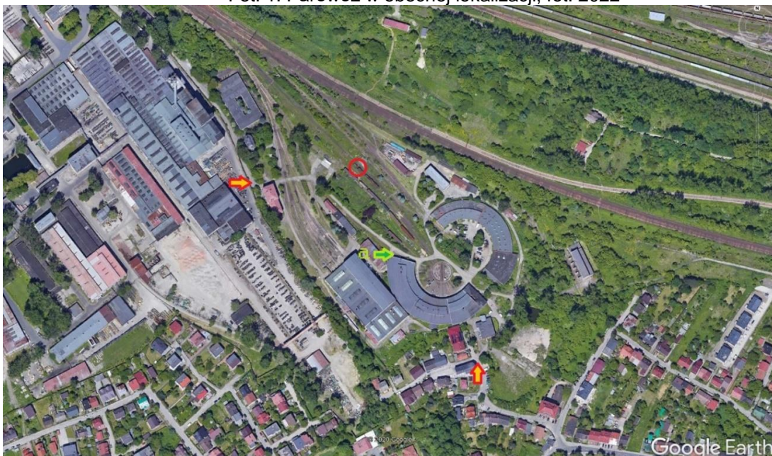
Fot. 2: Zdjęcie satelitarne przedstawiające miejsce stacjonowania parowozu (oznaczone czerwonym kółkiem), dojazd do parowozowni Kraków-Płaszów (oznaczone żółtymi strzałkami), oraz proponowane miejsce załadunku (a).