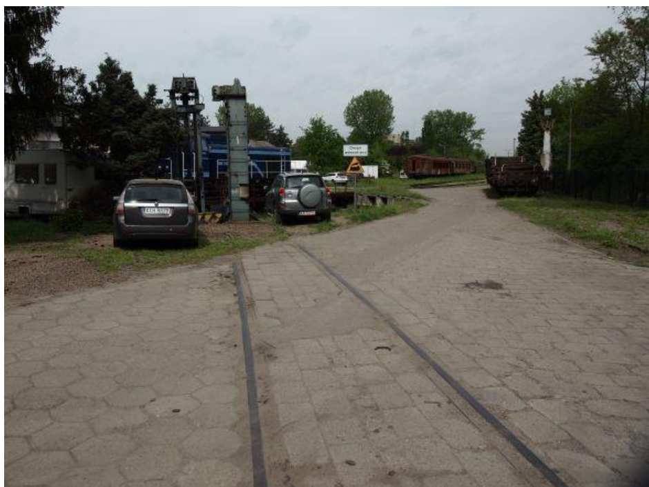
Fot. 9: Droga dojazdowa od strony ul. Kolejowej