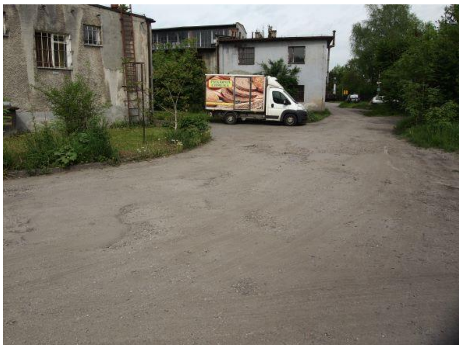
Fot. 11: Droga dojazdowa od strony ul. Kolejowej, widok w stronę parowozowni