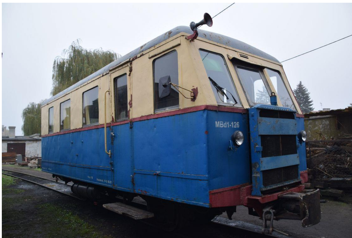
Fot. 9: Wagon spalinowy Mbd1-126 (W3M) nr inw. MUZ II 233