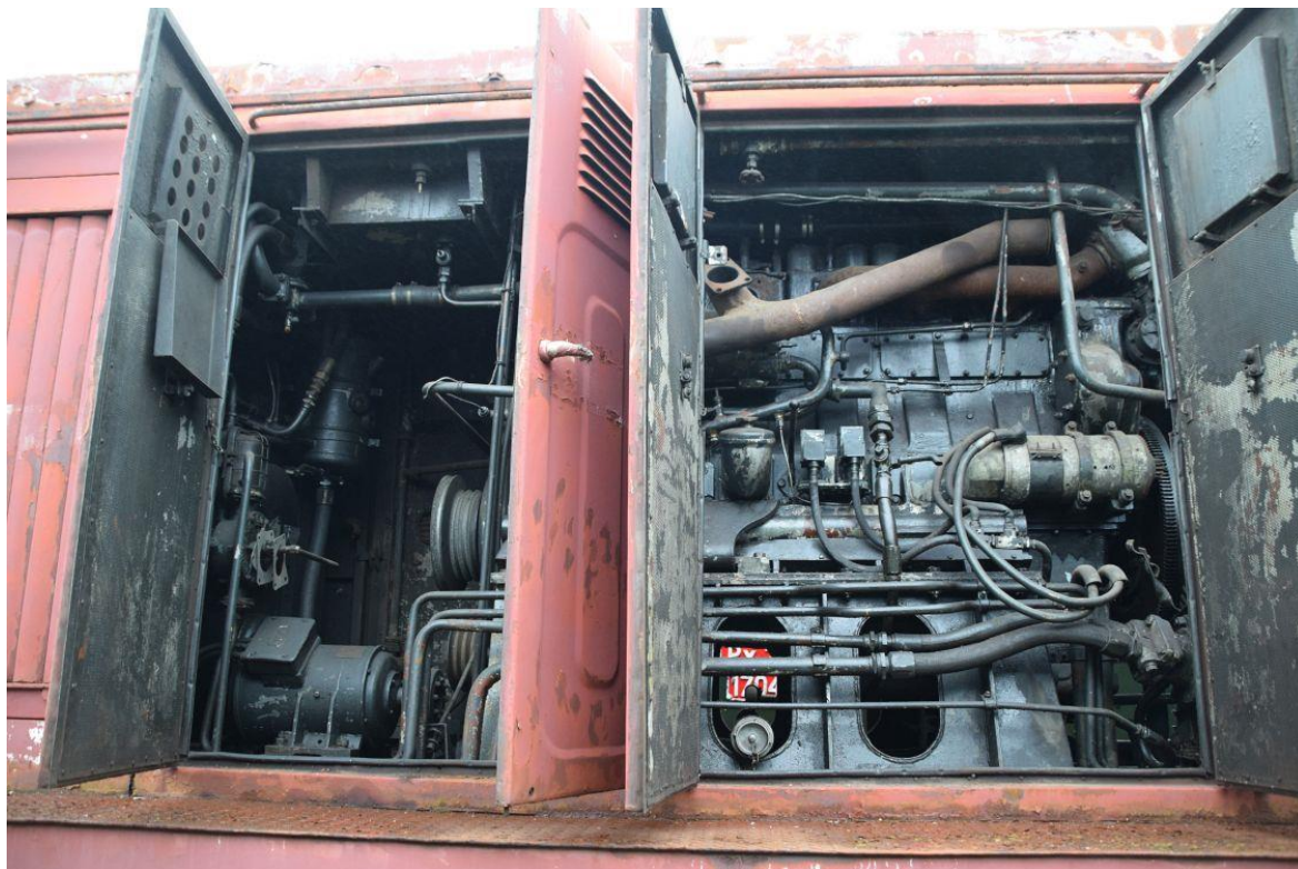
Fot. 2: Silnik lokomotywy spalinowej Lxd2-250 nr inw. MUZ II 232