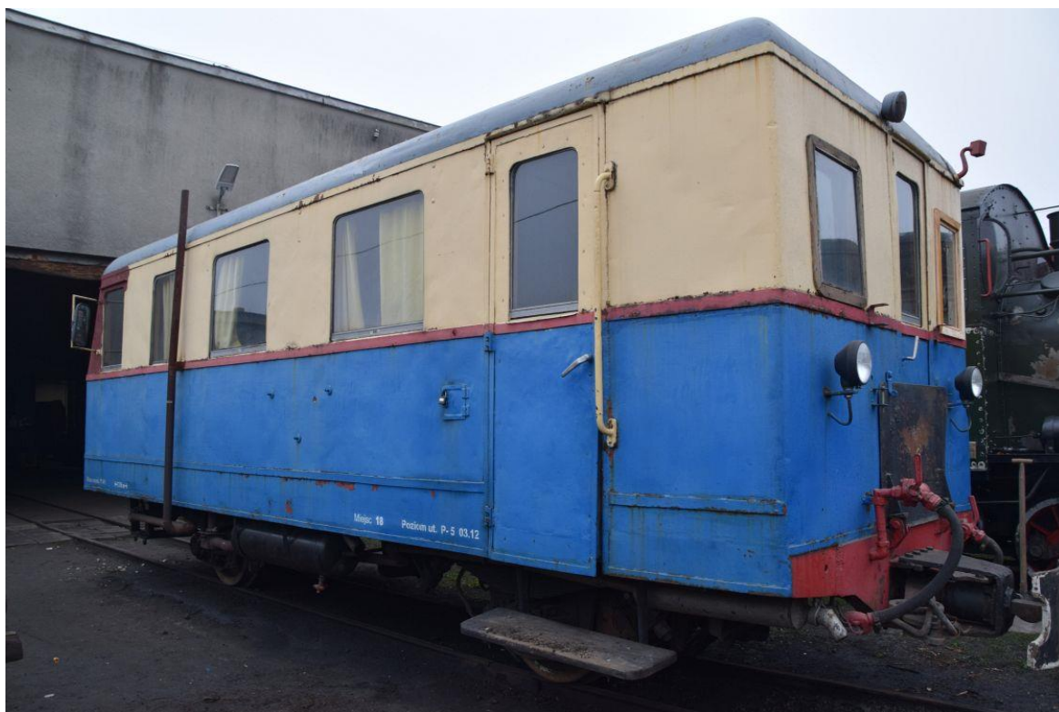
Fot. 10: Wagon spalinowy Mbd1-126 (W3M) nr inw. MUZ II 233