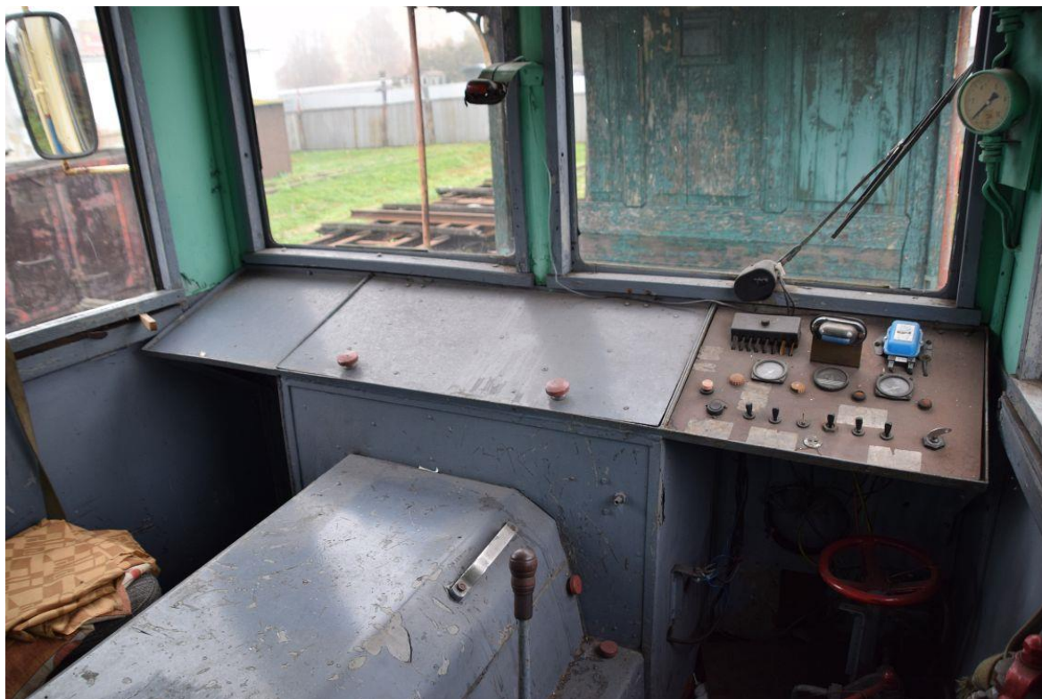
Fot. 7: Wnętrze kabiny maszynisty wagonu spalinowego Mbd1-130 (Mw63) nr inw. MUZ II 224