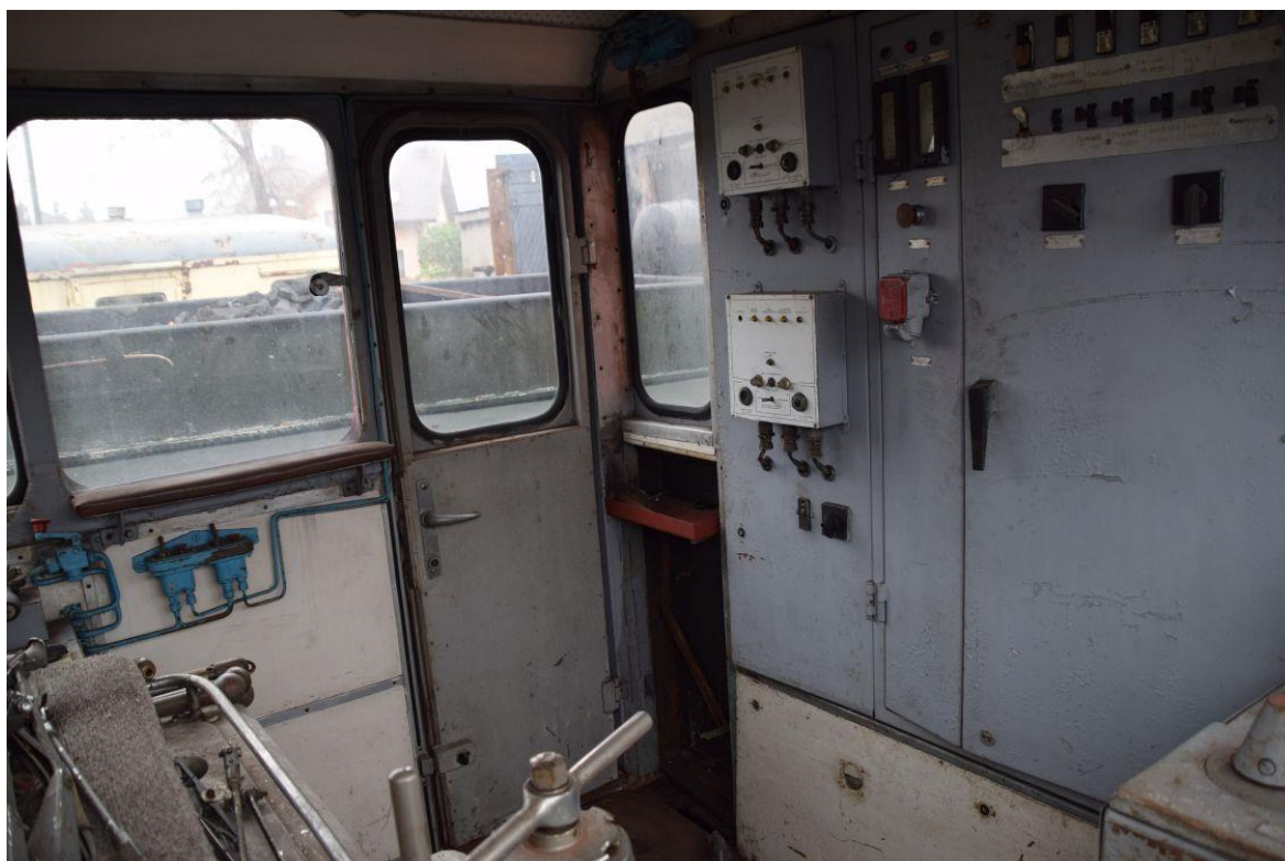
Fot. 4: Wnętrze kabiny maszynisty lokomotywy spalinowej Lxd2-250 nr inw. MUZ II 232