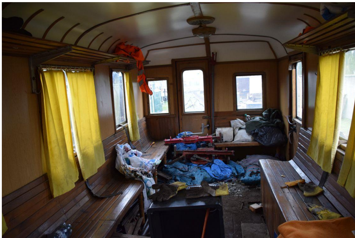
Fot. 11: Wnętrze przedziału pasażerskiego wagonu spalinowego Mbd1-126 (W3M) nr inw. MUZ II 233, fot. Marta Przygoda-Stelmach