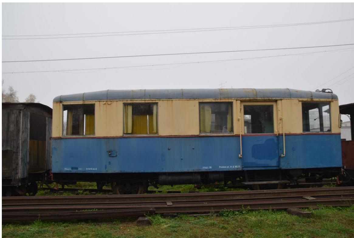
Fot. 5: Wagon spalinowy Mbd1-130 (Mw63) nr inw. MUZ II 224