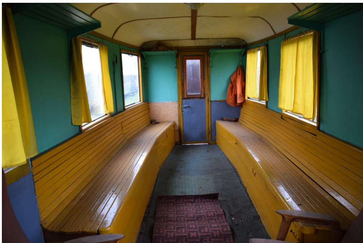
Fot. 6: Wnętrze przedziału pasażerskiego wagonu spalinowego Mbd1-130 (Mw63) nr inw. MUZ II 224