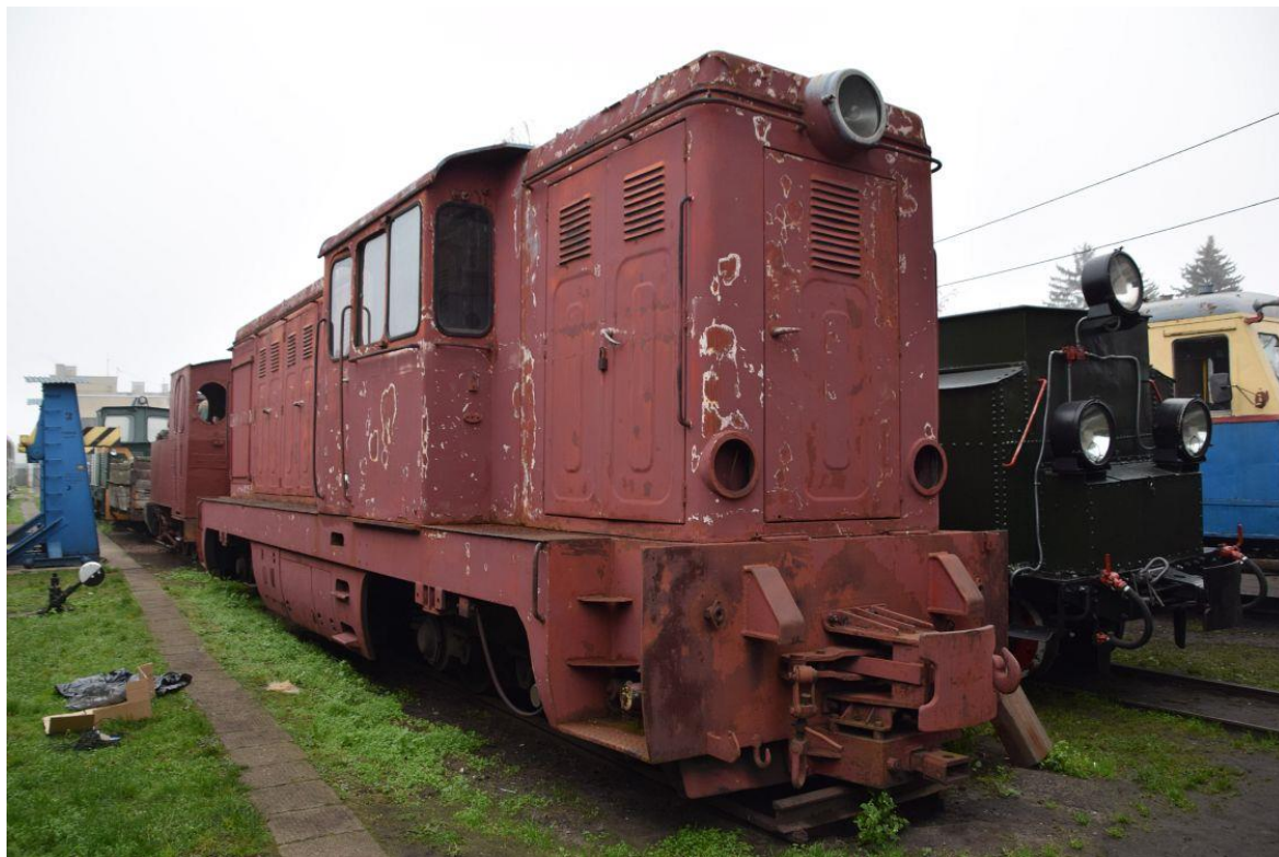
Fot. 1: Lokomotywa spalinowa Lxd2-250 nr inw. MUZ II 232