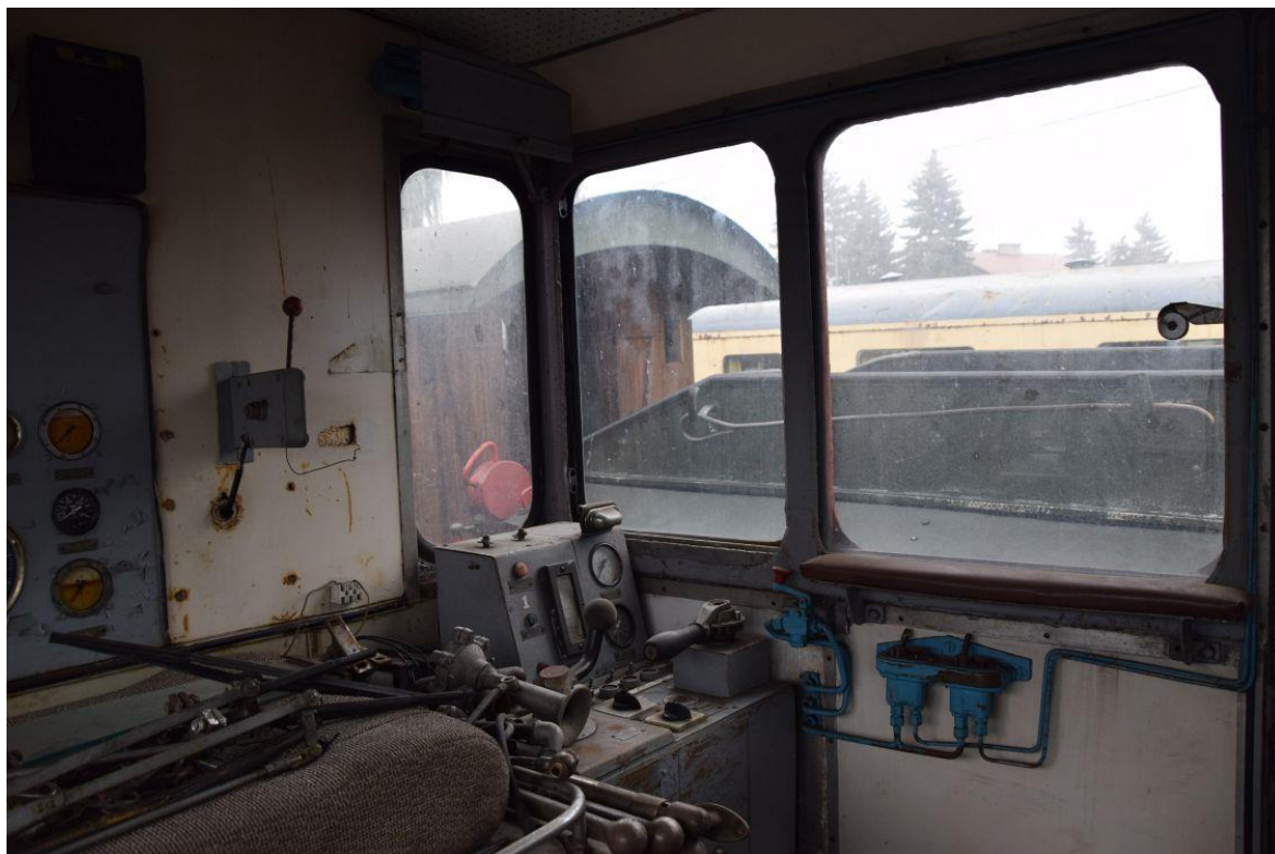
Fot. 3: Wnętrze kabiny maszynisty lokomotywy spalinowej Lxd2-250 nr inw. MUZ II 232