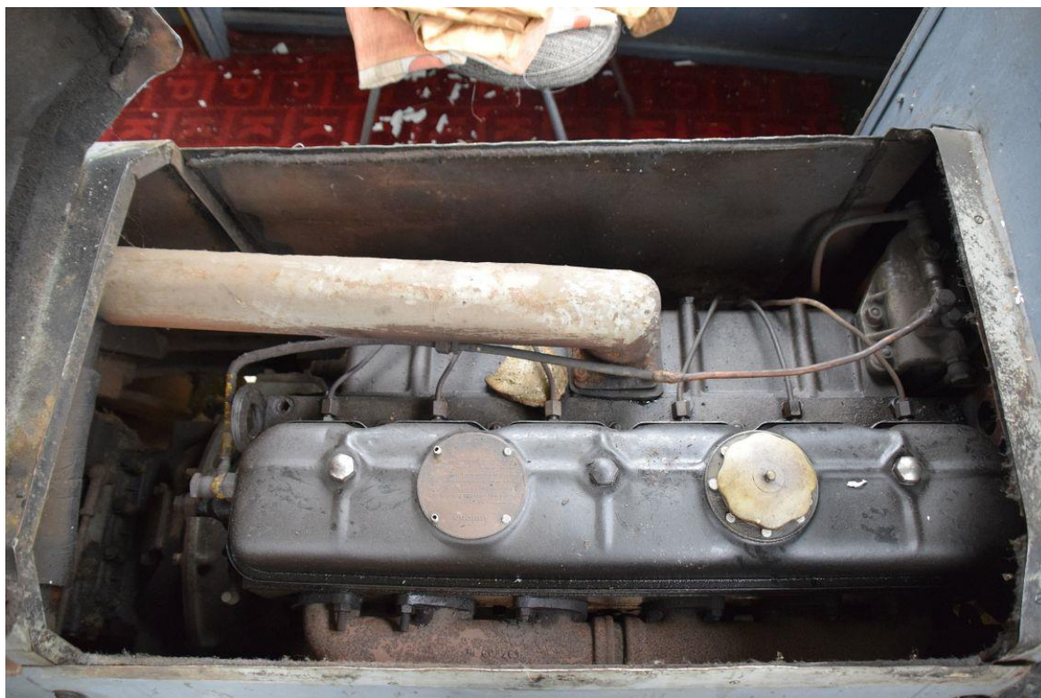
Fot. 8: Silnik wagonu spalinowego Mbd1-130 (Mw63) nr inw. MUZ II 224